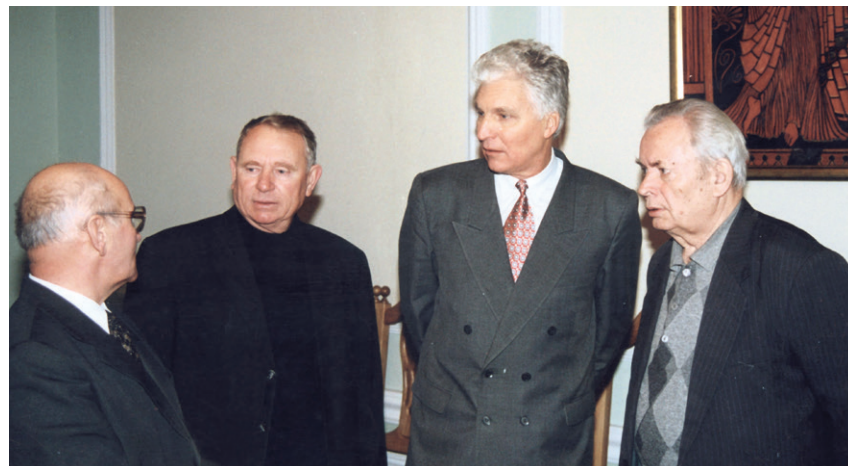
Колішні заступники голови Судової палати у кримінальних справах Верховного Суду України Є.І. Овчинніков, В.І. Кононенко, суддя Верховного Суду України В.В. Земляной, суддя Верховного Суду України у відставці Г.І. Давиденко (жовтень 2001 р.)