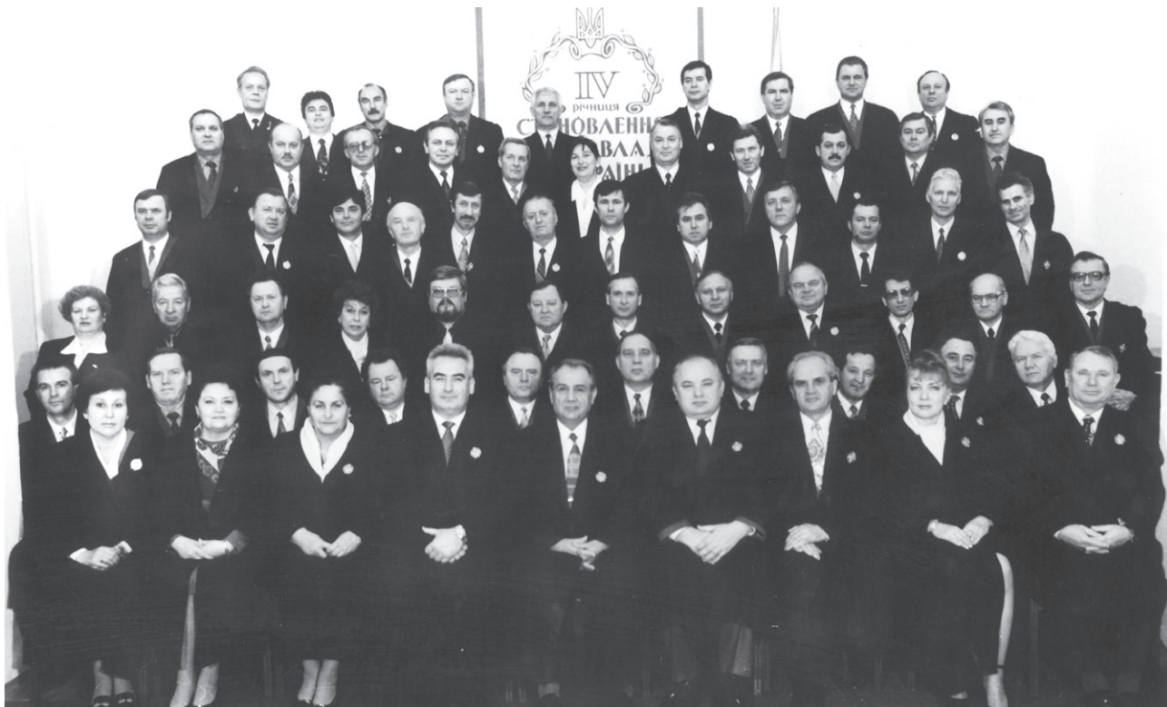
Судді Верховного Суду України. В.І. Кононенко — перший праворуч (грудень 1997 р.)

При розробленні КПК України пішли дещо іншим шляхом. Участь присяжних засідателів поки що передбачається у справах, де фігурують кримінальні статті, пов'язані з мірою покарання у вигляді довічного ув'язнення. Та й кількісний